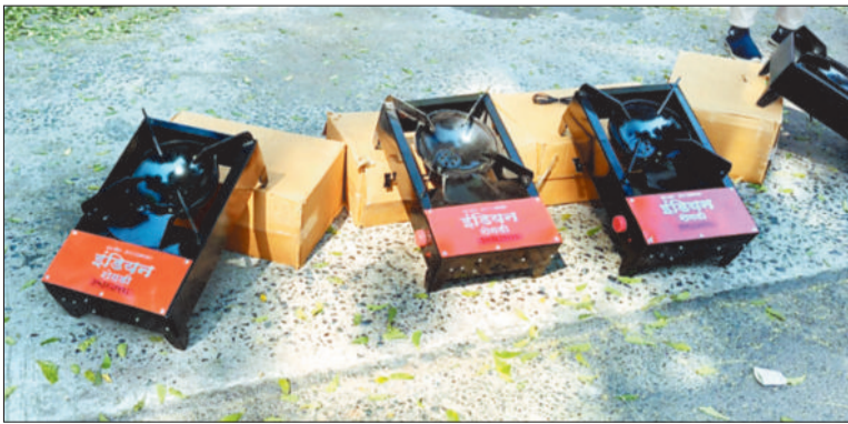
सड़क पर बेचने के लिए रखे गए आधुनिक चूल्हे।

ईरान-अमेरिका और इजराइल युद्ध से उपजी गैस सिलेंडर की समस्या अब सड़कों पर नजर आने लगी है। आने वाले समय में यह परेशानी और बढ़े इससे पहले ही शहर के लोग तैयारियों में जुट चुके हैं। गैस सिलेंडर के बेहतर विकल्प के रूप में लोगों ने सबसे पहले इंडक्शन चूल्हे को रखा है, जिसे बिजली से आसानी से चलाया जा सकता है। इंडक्शन की खरीदारी न केवल घरेलू उपयोग के लिए की जा रही है, बल्कि छोटे