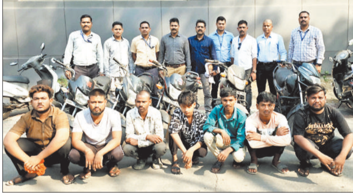
पुलिस गिरफ्त में बाइक चोरी के आरोपी।