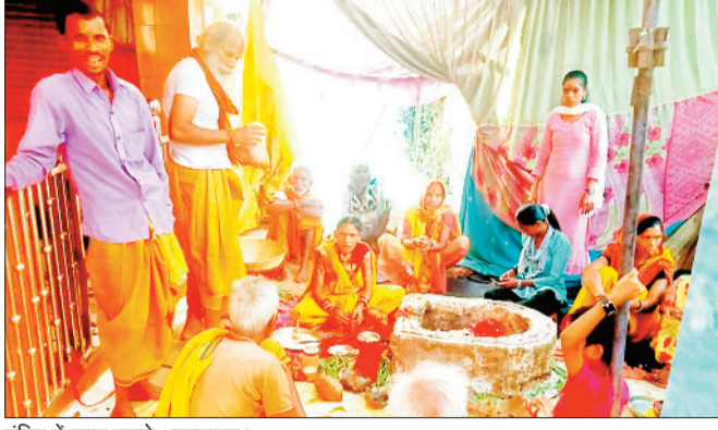
मंदिर में हवन करते श्रद्धालुजनों।

चैत्र नवरात्रि की अष्टमी तिथि पर क्षेत्र के देवी मंदिरों में सुबह से लेकर रात्रि तक भोजन चला रहा। मंदिरों में दिन भर हवन-पूजन व चढ़ोतरी का सिलसिला चलता रहा। नवरात्रि की अष्टमी तिथि के अवसर पर सुबह से दिन भर देवी मंदिरों में श्रद्धालुओं का तांता लगा रहा। नगर के मध्य में स्थापित महामाया मंदिर, पंडरिया रोड में शक्तिमाई, खरीपारा में काली मंदिर, अंगार मोती मंदिर, दाउपारा में महामाया मंदिर, गायत्री मंदिर मल्हापारा सहित अनेक मंदिरों में भक्तों की भारी भीड़ लगी रही। अष्टमी के अवसर पर देवी मंदिरों में विविध अनुष्ठान