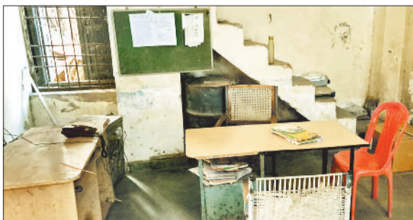
बिजली विभाग के प्यूज कॉल सेंटर से कर्मचारी नदारद।

बिजली विभाग का प्यूज कॉल सेंटर लोगों को सहायता देने के बजाए परेशानी का सबब बन रहा है। गर्मी आते ही बिजली बंद की समस्या बढ़ चुकी है। ऐसे में उपभोक्ताओं के द्वारा बंद की शिकायत के लिए प्यूज कॉल सेंटरों में कॉल किया जाता है, लेकिन आपरैटर्स के द्वारा फोन तक