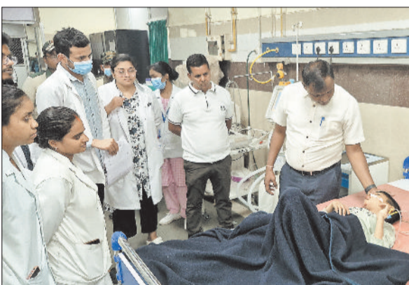
अस्पताल में भर्ती बच्चे की जांच करते डाक्टर।