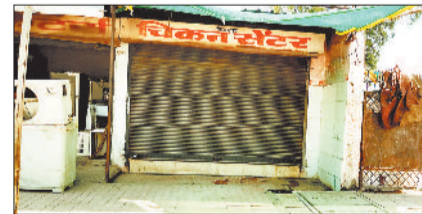
बंद रही दुकानें।