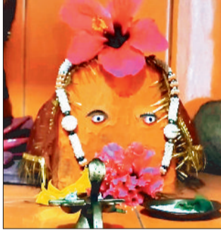
रामनवमी पर विशेष अनुष्ठान, बड़ी संख्या में श्रद्धालु होंगे शामिल